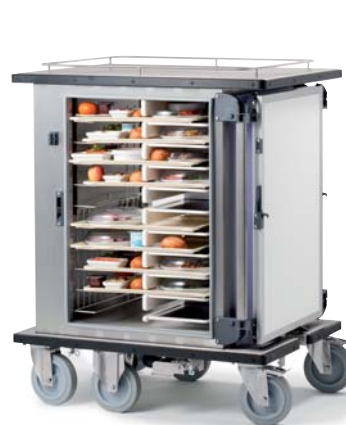
Vitalis Evo Carbo GN-255