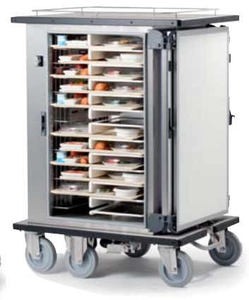
Vitalis Evo Single GN-315