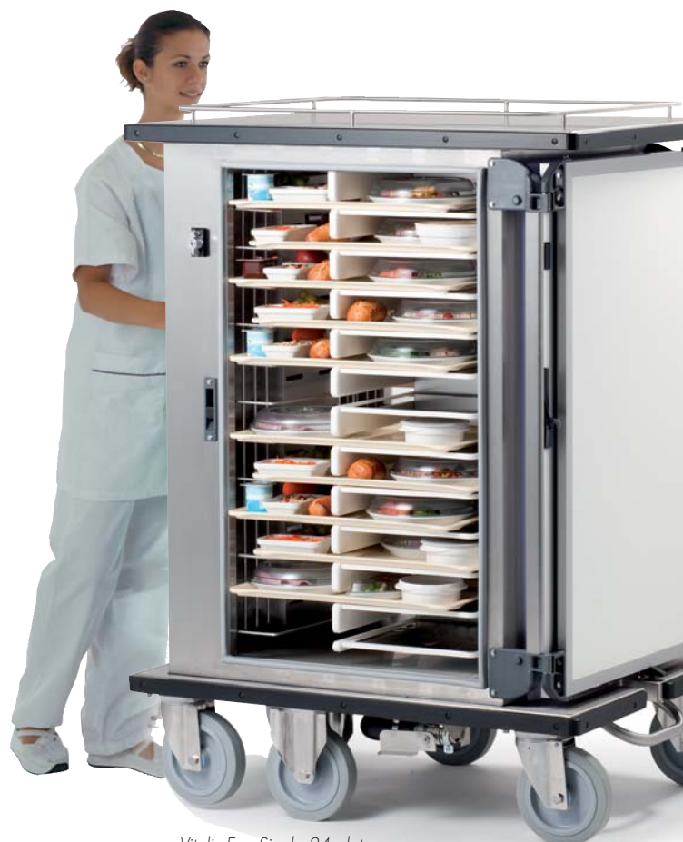
Vitalis Evo Single 24 plateaus met optie centrale rem en dak-stootrand